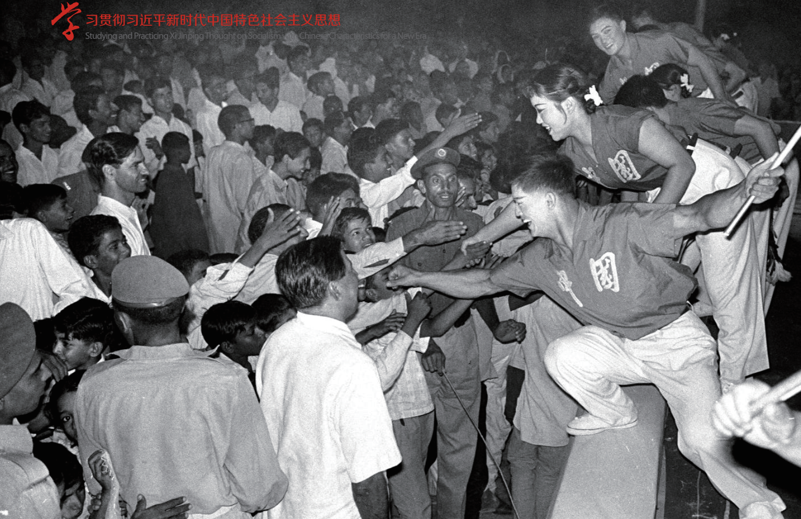
1966年11月30日，巴基斯坦观众争相与到访的中国文艺工作者握手。

类社会也因此创造了更加融通的现代文明。20世纪初，马克思主义从西方传播到中国，中国与欧洲国家分别作为东西方文明的代表进入了文明交流的一个重要转折点。中国共产党诞生后，将马克思主义作为指导思想，开创了中国革命和建设的新天地，展现了中华文明的时代风采，更大程度地促进了世界文明的丰富与发展。