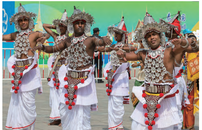
2019年5月16日，亚洲文明巡游活动在北京举行。图为来自韩国、尼泊尔、泰国、斯里兰卡等国的演员在巡游活动中表演。

彩的文明观，不仅使西方文化变得日益狭隘和封闭，还必将加剧文明的冲突，引发民族仇恨和动荡。中华民族在5000多年的文明发展历程中始终遵循“和而不同”原则，在坚定文化自信的同时，理解并尊重其他国家的文明，也因此为人类的文明进步作出了不可磨灭的贡献。中华人民共和国成立后，中国政府和人民坚决主张不同文明相互尊重、相互借鉴，各国都走符合自身国情和民众需要的文明发展道路；绝对不搞文化殖民和意识形态输出，不谋求改变其他国家的政治制度和发展模式，不干涉别国内政；旗帜鲜明地反对各种形式的文明优越论和执意改造甚至企图取代其他文明的做法，努力实现不同文明的和谐共存、美美与共。