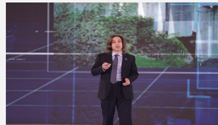
意大利机器人国家能力中心主席 安东尼奥·弗里索利 (2023)