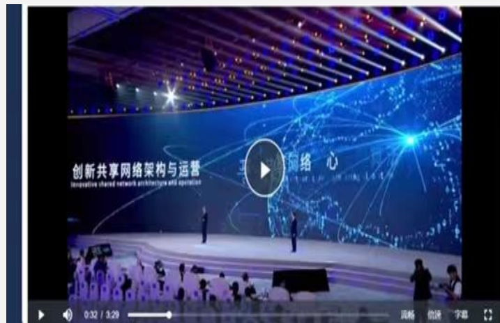
中国电信副总经理 李峻 中国联通副总经理 梁宝俊 联合发布 (2023)