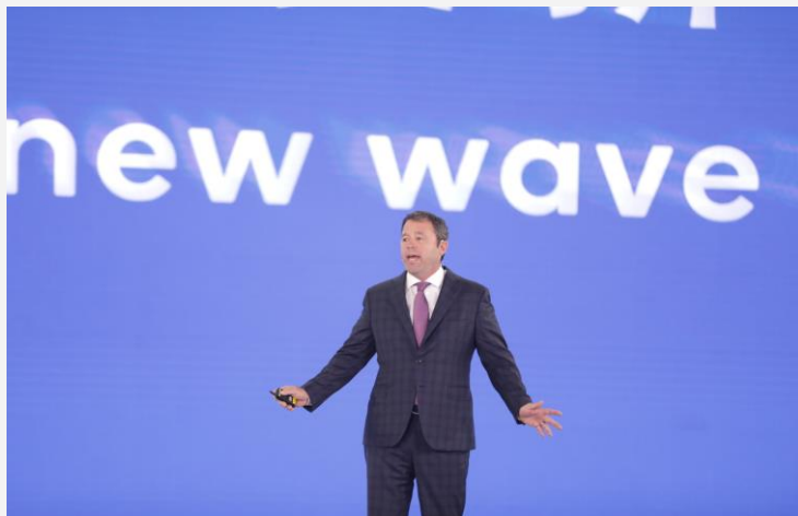
高通技术公司首席商务官 吉姆·凯西 (2023)