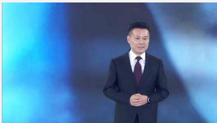
IBM大中华区董事长兼总经理 陈旭东 (2023)