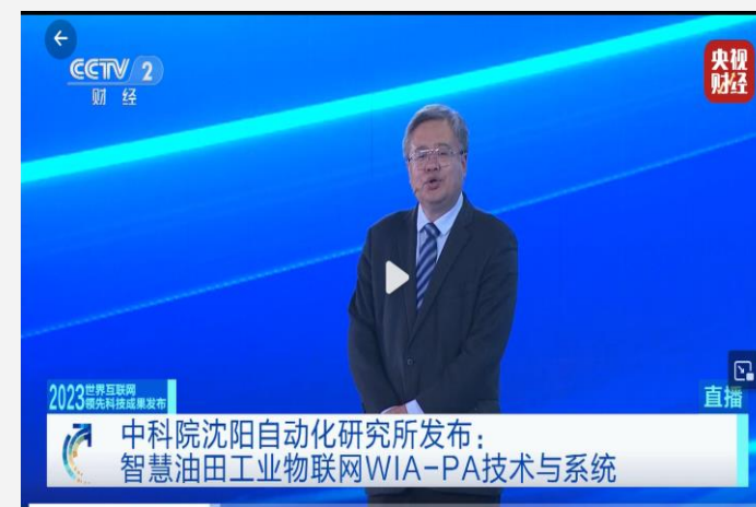
中国工程院院士 于海斌 (2023)